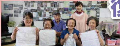
NPO法人サンガ岩手 復興スタディツアー